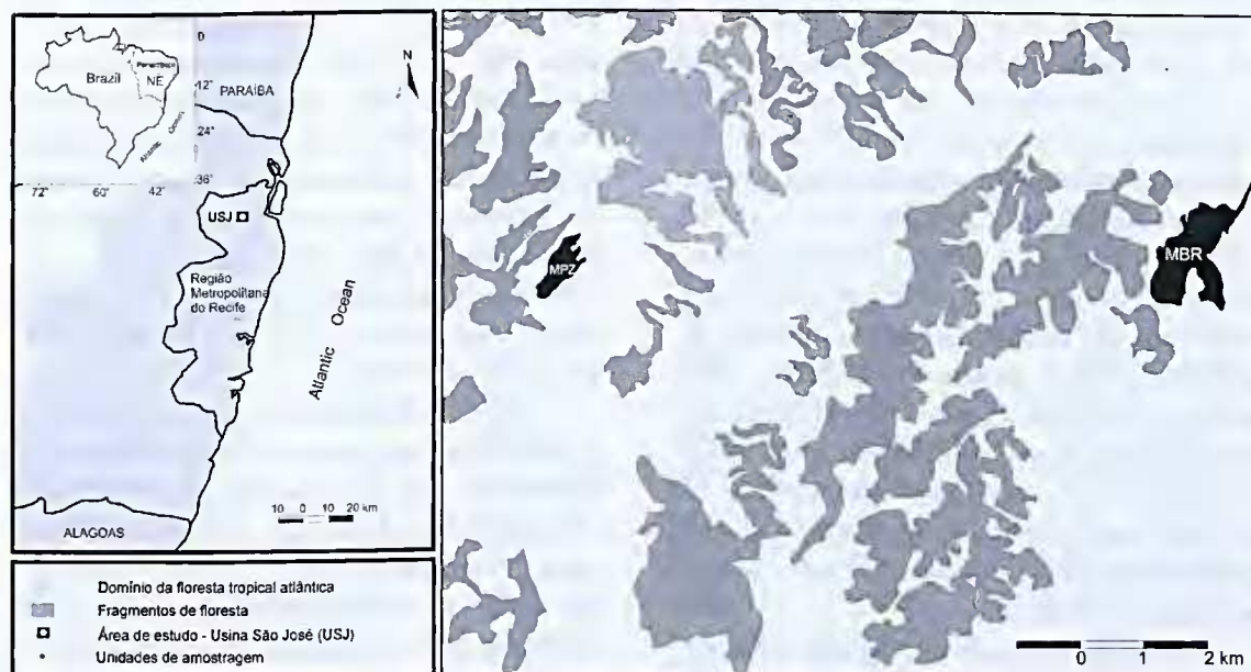
Figura 1 – Localização das áreas de estudo do sub-bosque lenhoso, Mata do Pezinho (MPZ) e Mata da BR (MBR), em Igarassu, Pernambuco.

Os remanescentes florestais estudados estão inseridos no domínio da mata atlântica ou floresta ombrófila densa das terras baixas (IBGE 1992). Foram estudados dois fragmentos localizados na Usina São José (Fig. 1), em Igarassu, Pernambuco (07°41'04,9" e 07°54'17,6"S; 34°54'17,6" e 35°05'07,2"W), apresentando 27 ha (Mata do Pezinho, doravante chamada MPZ) e 99 ha (Mata da BR, aqui chamada MBR). Segundo a classificação de Köppen, o clima da área é do tipo As' (tropical quente e úmido) com precipitação média anual de 1687 mm, as chuvas são concentradas de abril a agosto e a temperatura média é de 25,1°C (dados da Usina São José, período de 1998 a 2006). A geologia predominante na região é a do Grupo Barreiras, de idade plio-pleistocênica, constituído por sedimentos areno-argilosos não consolidados, de origem continental. O relevo é constituído por tabuleiros, que são feições de topos planos, entrecortados por vales estreitos e profundos,